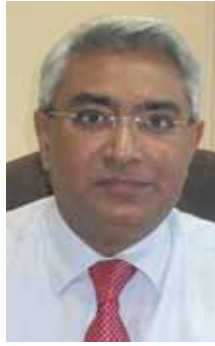
رفيق حلاني سلامة للتأمين