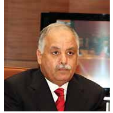
البغدادي المحمودي رئيس الوزراء الليبي

تعزز الجماهيرية الليبية في احدث خطوة تتخذها لتعزيز العلاقات مع النيجر استثمار ١٠٠ مليون دولار في هذا البلد. ووضح رئيس الوزراء الليبي البغدادي المحمودي خلال زيارة للقاء رئيس المجلس العسكري الحاكم في النيجر سالوجيبو «اعلن انشاء صندوق الاستثمار لكنه لم يحدد القطاعات التي تريد ليبيا الاستثمار فيها». والنيجر احدى افقر دول العالم وهي تكابد الصعاب من جراء نقص الغذاء ومن اكبر المستثمرين فيها شركة الطاقة النووية الفرنسية اريفا ومؤسسة النفط الوطنية الصينية ويعد من البلدان المنتجة لليورانوم.