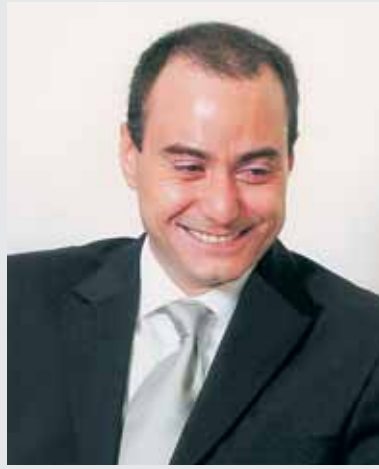
بقلم المهندس زياد زخور

يعيش لبنان منذ اكثر من سنتين حالة «هلع» عقارية غير مسبوقه.