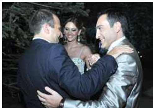
العروسان يتقبلان التهاني من الوزير باسيل

بعد الحفل سافر العروسان الى مكسيكو وفلوريدا لقضاء شهر العسل. الف مبروك