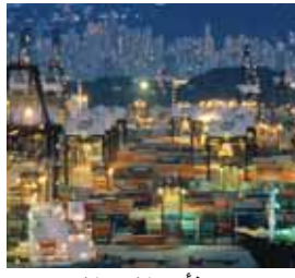
مرفأ هونغ كونغ