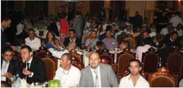
جانب من احدى الحفلات