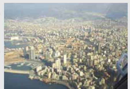
بيروت - لبنان

عندما قلنا في هذه المجلة ان حركة بيع الشقق السكنية قد تباطأت رد علينا اصحاب المشاريع العقارية الضخمة في دراسات وتصاريح يؤكدون فيها على تزايد الطلب لشراء الشقق السكنية