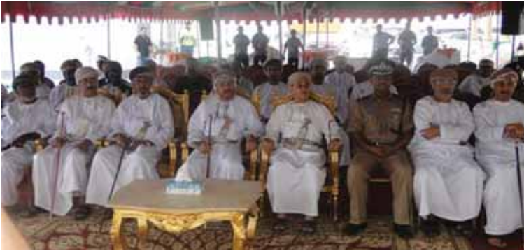
خلال حفل الافتتاح

احتفل بنك ظفار BANK DHOFAR بالافتتاح الرسمي لفرعه الجديد في ريسوت، وذلك برعاية رئيس بلدية ظفار الشيخ سالم بن عوفيت الشنغري. ومع الافتتاح الرسمي للفرع الجديد توسعت شبكة فروع بنك ظفار لتصل إلى ٥٤ فرعاً، و١٢١ من أجهزة الصراف الآلي وأجهزة الإيداع وسداد الفواتير في جميع أنحاء السلطنة. وسيقدم الفرع الجديد مجموعة متكاملة من المنتجات والخدمات المصرفية، متضمناً خدمات فتح الحساب، وصرف العملات، والودائع الثابتة، وبطاقات السحب والائتمان، إضافة إلى القروض الشخصية والإسكانية. ويمكن كذلك للزبائن القيام بعملية تحويل الأموال وسداد الفواتير الإستهلاكية بكل سهولة ويسر. وللمناسبة قال الرئيس التنفيذي بالوكالة محمد رضا أحمد جواد: إن الافتتاح الرسمي لفرع ريسوت يأتي تزامناً مع إحتفالات البلاد بعيد النهضة المباركة الأربعين المجيد، ليؤكد على دعم بنك ظفار والتزامه المؤسسي بدفع عجلة التنمية التي تشهدها بلادنا الحبيبة في ظل القيادة الحكيمة لحضرة صاحب الجلالة السلطان قابوس بن سعيد. مجددين عهدنا في تقديم خدمات مصرفية متكاملة من خلال هذا الفرع وذلك بتوفير كافة الخدمات المصرفية للأفراد والمؤسسات بما يتوافق مع أفضل معايير الخدمة من حيث نوعية الخدمات وتنافسيتها.