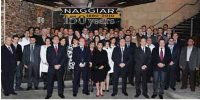
فريق عمل نجار

وشدد على جودة المواد المعدنية والتي تتميز بنوعية عالية مقارنة بمواد البناء التقليدية .