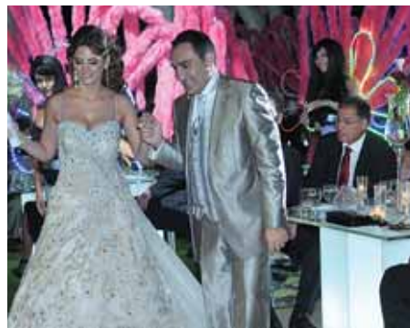
العروسان الى حلبة الرقص