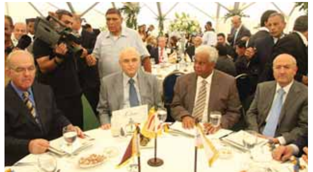
من اليمين: الوزير غازي العريضي، الوزير القطري عبدالله العطية، نادر الغزال وجورج فضل الله