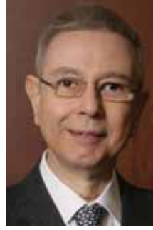
عبد الحميد شومان ARAB BANK - الاردن