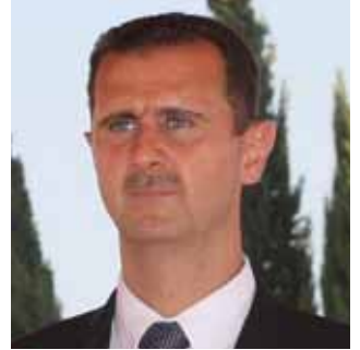
بشار الاسد رئيس سوريا

يستمر مصرف سورية المركزي برئاسة الدكتور اديب ميالة في تنفيذ خطة تحديثه الصادرة بقرار مجلس النقد والتسليف رقم (١٨٧/م ن / ب ١) تاريخ ٢٠٠٦/٢/١٤ والمصادق عليها من قبل رئيس مجلس الوزراء بتاريخ ٢٠٠٦/٢/٢٧، والسعي الى تحقيق اهداف الخطة الخمسية العاشرة بما ينسجم مع خطة التحديث والتطوير التي يقودها الرئيس بشار الاسد والتي اعلنها منذ توليه مهامه الدستورية.