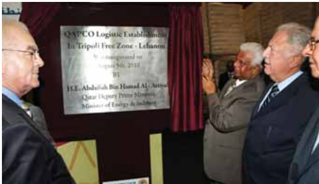
الوزير القطري عبدالله العطية يزبح الستار عن اللوحة