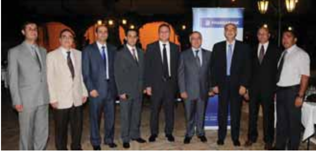
فريق فرنسبنك يستقبل المدعوين