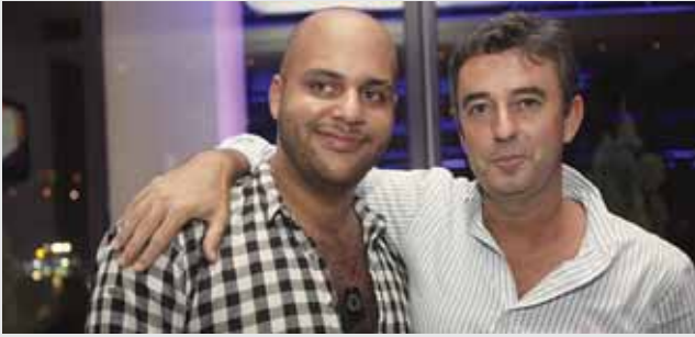
سفير اسبانيا خوان كارلوس غافو مع المخرج يوسف خيزران