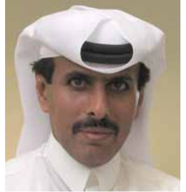
عبد الله بن سعود آل ثاني

قام مصرف قطر المركزي الشهر الماضي بخفض معدل فائدة ودائع البنوك المودعة لديه لمدة ليلة واحدة QMR الى ١,٥ في المئة بعد ان كانت ٢ في المئة. وبزّر المصرف خطوته في بيان قال فيه «قمنا باستخدام احدى ادوات السياسة النقدية وتم خفض هذا المعدل لاسباب عدة، اولها انه خلال عام ٢٠٠٩ تم تسجيل معدل تضخم سلبي بمقدار ٤,٩ في المئة واستمر هذا الانخفاض خلال النصف الاول من العام الحالي، موضحا انه مع استمرار المعدل السلبي للتضخم وارتفاع المعدل الاسمي للفائدة، فإن هذا يعني ارتفاع معدل الفائدة الحقيقي».