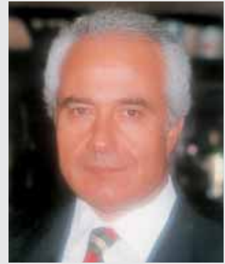
يكتبها د. عبد الحفيظ البربير