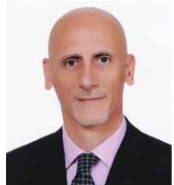
جان كلود نجيم