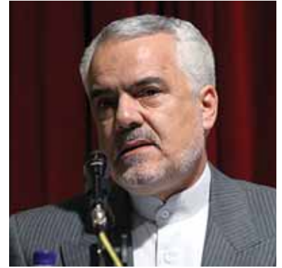
محمد رضا رحيمي نائب الرئيس الايراني

هددت ايران بالتخلي عن التعامل بالدولار واليورو بما في ذلك قيمة صادراتها النفطية ردا على العقوبات الاقتصادية الغربية. وقال نائب الرئيس الايراني محمد رضا رحيمي في حديث له «سننتخلى عن الدولار واليورو في سلتنا للعملات الاجنبية ونعتمد بدلا منهما الريال او عملة اي بلد يقبل التعاون معنا». وقال ان العملاتين الدولار واليورو قذرتان ولن نبيع نفطنا مقابل الدولار او اليورو. ولم يوضح كيف ستفعل ايران لتنفيذ سياستها هذه. وقال رحيمي ان ايران ستحد من المنتجات التي تشتريها من الاتحاد الاوروبي والتي بلغت قيمتها ١١,٤ مليار يورو خلال ٢٠٠٩ اي ٢٧٪ من الايرادات الايرانية حسب احصائيات الاتحاد الاوروبي الرسمية. واضاف ان ايران ستتوقف خصوصا عن استيراد مواد غذائية مثل القمح والصويا من اوروبا وستبدأ برنامج انتاج محليا لكافة قطع الغيار المعقدة التي تشتريها ايران حاليا من اوروبا.