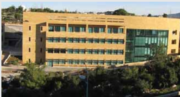
مشروع جامعة بيروت العربية - الدبية

أعلنت شركة QUALCO للانشاءات عن انتهاء أعمال المرحلة الأولى من مشروع جامعة بيروت العربية في الدبية، وشملت هذه المرحلة إنجاز بنية تحتية كاملة من شوارع وأرصعة طول ٩ كيلومترات وشبكات كهرباء وهاتف وإنارة، إضافة إلى محطة كهرباء ومبنى للصيانة وقاعة رياضية مغلقة وملعب أخضر لكرة القدم بمساحة ١٥ ألف متر مربع.