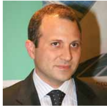
جبران باسيل وزير الطاقة والمياه

يكاد وزير الطاقة والمياه جبران باسيل الوزير الوحيد الذي يكرهه فريق كبير من الناس لانه يقول لهم الحقيقة عن أزمة الكهرباء ويؤكد لهم بأنها ستطول.. وهؤلاء الناس لا يريدون ان يسمعون من الوزير الاسباب التي ادت الى الأزمة والتي ستؤدي الى اطالتها.. فهم يريدون ان تؤمن لهم الكهرباء فحسب.