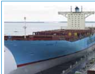
صورة لبخارة EBB MAERSK تبلغ سعتها الاجمالية 13500 TEU وهي من اكبر البواخر في العالم

وتجدر الإشارة الى ان المجموعة الفرنسية كانت اجرت مفاوضات عدة مع عدد كبير من المستثمرين الراغبين ان تكون لهم حصة في رأسمال CMA CGM لكن هذه المفاوضات لم تصل الى نتائج ايجابية. فقد تفاوضت المجموعة مع كل من :