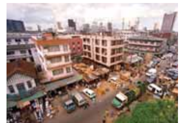
لاغوس عاصمة نيجيريا

صنفت وكالة ا.م. بست A.M.BEST القدرة المالية لشركة كونتيننتال ري النيجيرية CONTINENTAL RE , NIGERIA بمرتبة بي واحدة (B1) التي تعني (معتدل) FAIR. وذكرت الوكالة ان الشركة تتمتع برسملة قوية قياساً بالاحاطار التي تحملها و بنتائج اكتبائية جيدة، وبمستوى متحسن من ادارة الاحاطار. الا ان بست ترى ان لائحة معيدين التأمين الذين يوفر لهم الحماية تنطوي على اسماء معيدين غير مقتدرين ما يجعل ضمانتها غير كافية INSUFFICIENT SECURITY WITHIN THE REINSURANCE PANEL. كما ان الشركة تواجه صعوبات معينة في تحصيل المبالغ العالقة لمصلحتها في ذم الشركات المسندة.