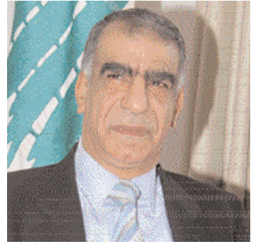
اكرم شديد رئيس المجلس الاعلى للجمارك

بينت احصاءات الجمارك اللبنانية ان المجموع العام للواردات الجمركية والضريبة على القيمة المضافة (TVA) والمستوفى عبر كافة المرافئ والبوابات خلال شهر تموز (يوليو) الماضي حافظ على نموه للشهر الثاني على التوالي. كما افادت ان المجموع المحصّل في تموز ٢٠١٠ جاء اكبر بكثير مما كان عليه في الشهر نفسه من العام ٢٠٠٩.