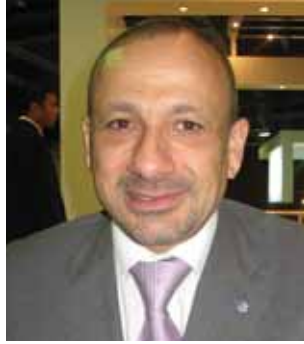
جوزف كوبا ROTANA

افتتحت روتانا ROTANA الشركة الرائدة في ادارة الفنادق في منطقتي الشرق الاوسط وشمال افريقيا، فندق اوريكس روتانا اول الفنادق التي تديرها في الدوحة. والفندق قريب من مطار الدوحة الدولي وعلى مسافة دقائق من وسط المدينة وهو مؤلف من ٤٠٠ غرفة.