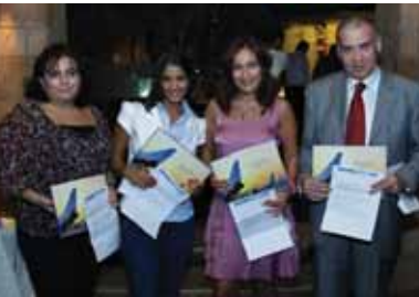
الاعلاميين الاربعة الذين فازوا ببطاقات السفر

اقامت شركة فلاي دبي اولى ناقلة FLY DUBAI اقتصادية في دبي، افطارا تكريما لوسائل الاعلام اللبنانية في مطعم «مندلون سور مير» في مجمع ببال وسط بيروت. وتخلل الافطار وهو الاول لـ «فلاي دبي» في لبنان سحب على اربع بطاقات سفر ذهابا وايابا الى اي من وجهات الشركة الثلاث والعشرين.