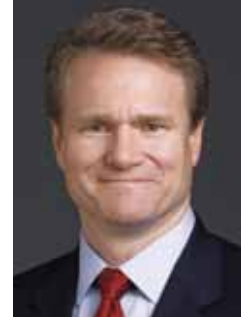
BRIAN T. MOYNIHAN