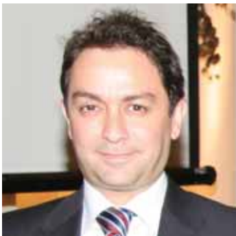
زياد بارود وزير الداخلية

انشأ متمولون لبنانيون مدينة خاصة ليصار فيها التدريب على قيادة السيارات بموجب القوانين الحديثة النافذة. وزير الداخلية زياد بارود شارك في افتتاح المدينة «ريو سيتي» في وادي نهر الكلب بحضور رؤساء بلديات ومعنيين. بعد استماعه الى اهداف المشروع الاستثماري والارشادي وتجربته شخصيا للسيارة المخصصة للتدريب قال بارود: علينا ان نشارك وزارتي الداخلية والتربية والمجتمع المدني في المقام الاول لتعريف للمواطن ثقافته الصحيحة في ممارسة القيادة على طرقنا كما يقودها في الخارج