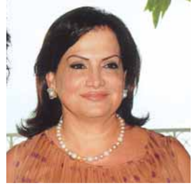
اللبنانية الاولى وفاء سليمان

كانت من احلى وارقى الجمعيات النسائية، انه حفل الغداء الذي اقامته اللبنانية الاولى وفاء سليمان عقيلة فخامة رئيس الجمهورية العماد ميشال سليمان في حديقة قصر بعبد يوم جمعة من هذا الصيف المشرق. اناقة ورقة السيدة الاولى المعروفة بنعومتها وتواضعها واشراقها عطرنا اللقاء الذي دعيت اليه مئة وخمسون سيدة من الصديقات والمقربات تسلمن عند دخولهن الى القصر هدايا تذكارية رسمت عليها ارزة لبنان.