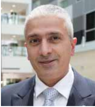
كيفورك دلديليان ROTANA