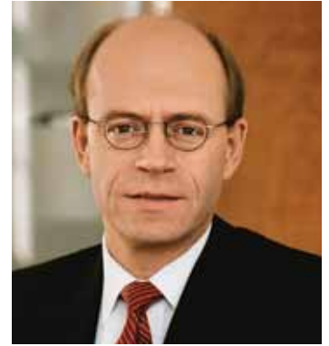
نيكولوس فون بومهارد

أذاعت ميونيخ ري MUNICH RE بياناً أعلنت فيه انها حققت خلال النصف الأول من العام ٢٠١٠ ارباحاً صافية بقيمة ١,٢ مليار يورو، وانها ماضية في سعيها لرفع ارباحها الصافية نهاية ٢٠١٠ الى ما يزيد عن ملياري يورو. واعرب نيكولوس فون بومهارد رئيس المجموعة عن ارتياحه لهذه النتيجة وقال ان التحسن الذي طرأ على عوائد الاستثمار امكن للمجموعة ان تجني عوائد استثمارية بقيمة ٥,١ مليارات يورو بزيادة ٤٢,٨ بالمئة عما كانت عليه خلال الفترة عينها من السنة الماضية. وقال طموحنا هو ان نحقق ارباحاً صافية بقيمة ٢ ملياري يورو نهاية هذا العام ونحن واثقون من اننا سوف نحقق ذلك الهدف.