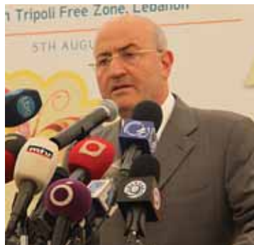
الوزير العريضي يلقي كلمة