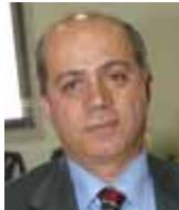
ايلي كاتانه INATEK