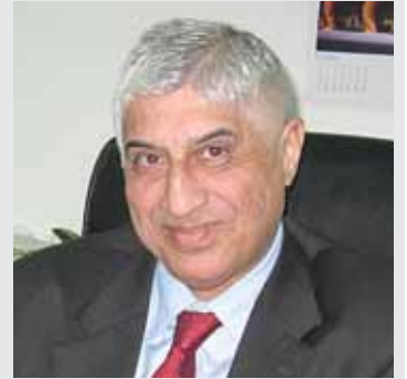
وسام الهيمص ALLIANCE

شركة اللائنس للتأمين الاماراتية ALLIANCE هي من بين شركات تأمين واعادة تأمين عربية قليلة حازت على تصنيف أ (A) . فقد اصدرت وكالة التصنيف الاميركية ا.م.بست . A.M.BEST بياناً بتاريخ ٧ آب (اغسطس) تعلن فيه انها اعادت تصنيف القدرة المالية والقدرة الائتمانية لشركة اللائنس للتأمين ومركزها دبي الامارات العربية المتحدة في مرتبة أ ماينوس A-MINUS التي تعني ممتاز.