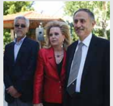
الوزير علي عبدالله، سهام حاراتي والقنصل العام البرازيلي ريناتو مينيزيس

شخصيات سياسية من وزراء ونواب وفاعليات واصدقاء واعضاء الجالية البرازيلية المقيمة في لبنان، حضروا الحفلة التي ميزتها الموسيقى والالوان البرازيلية والاستقبال الحار والاطباق الفاخرة.