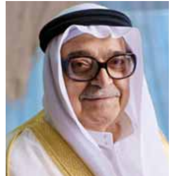
الشيخ صالح عبدالله كامل