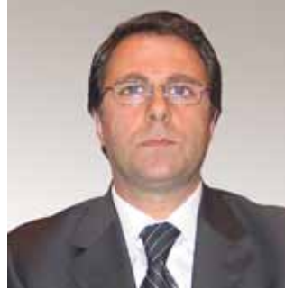
د. اديب ميالة مصرف سورية المركزي

وسط هذه المؤشرات المشجعة والمبشرة بمستقبل زاهر للقطاع حملت «البيان الاقتصادية» بعض الاستفسارات والاسئلة الى معنيين وخبراء في سدة المسؤولية مستطلعة اياهم عن نشاط المصارف الاسلامية والمنافسة في ما بينها وبين بقية المصارف، وعن الالتزام بالحد الأدنى للرأسمال الجديد، والخدمات التي توفرها للزبائن والعوائق التي تحول دون التوسع بالنشاطات، مستخلصة اجماعا حول توافر الفرص في مختلف القطاعات الانتاجية التي تتطلب قطاعا مصرفيا مواكبا لحاجاتها ومتطلباتها، وتنويعها بدور المركزي النقدي والمصرفي.