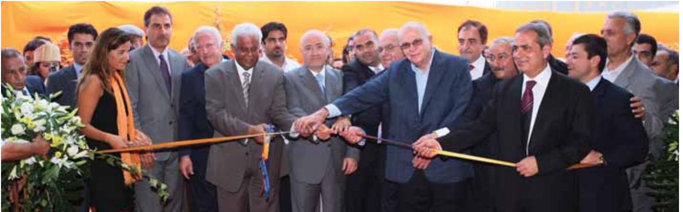
الوزير غازي العريضي والوزير القطري عبدالله العطية يقطعان الشريط