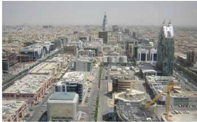
المملكة العربية السعودية

وفي سياق خطة التنمية التاسعة للمملكة فقد استأثر قطاع الاسكان والخدمات البلدية بنحو ٧ في المئة او ما يقارب من ١٠٠ مليار ريال من اجمالي ما تم رسده لها بإجمالي ١,٤٤ تريليون ريال وهو ما يزيد بنحو ٦٧ في المئة على ما رصد خلال خطة التنمية الثامنة، والتي تعكس توجهات بالاسراع في تنفيذ الاستثمارات والبرامج التنموية والمشاريع الاستراتيجية والتكيف مع التطورات الاقتصادية العالمية. وتهدف خطة التنمية التاسعة الى انشاء مليون وحدة سكنية بواسطة القطاعين العام والخاص لمواكبة ٨٠ في المئة من حجم الطلب المتوقع على الاسكان.