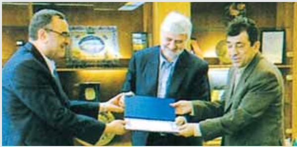
رئيس شركة اعادة التأمين الايرانية يتسلم الترخيص من بيمة مركزي

اعلنت بيمة مركزي BIMEH MARKAZI وهي شركة الاعادة الحكومية في ايران والتي تعنى في الوقت عينه بالاشراف على قطاع التأمين في ايران انها منحت ترخيصا لمجموعة من رجال الاعمال بتأسيس اول شركة مساهمة لاعادة التأمين وتحمل اسم شركة اعادة التأمين الايرانية IRANIAN REINSURANCE CO.