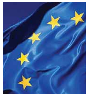
علم الاتحاد الاوروبي

ولذا تقترح المفوضية ان تعطى سلطات الرقابة الوطنية صلاحية الحصول على مستند او معلومة حول الشركة الأم، ومتفرعاتها، وذلك تجنباً لاي ازمة جديدة يمكن ان تحصل في اي مكان في العالم وتطل الشركات العاملة داخل الاتحاد الاوروبي . ويحتاج المشروع كي يصبح نافذا لموافقة المجالس النيابية في الدول الـ ٢٧ التي يتألف منها الاتحاد الاوروبي .