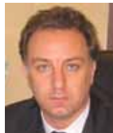
طلال الانسي ROYAL