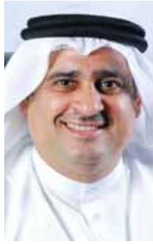
ابراهيم الرئيس البحرينية الكويتية